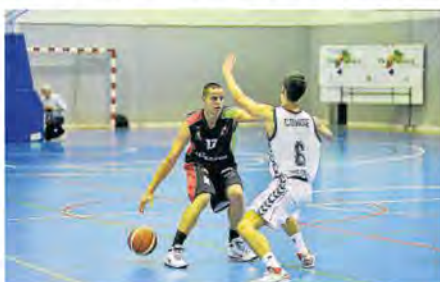
Veski intenta construir una jugada d'atac.

El Clínicas Rincón guanyà un partit que dominà per complet