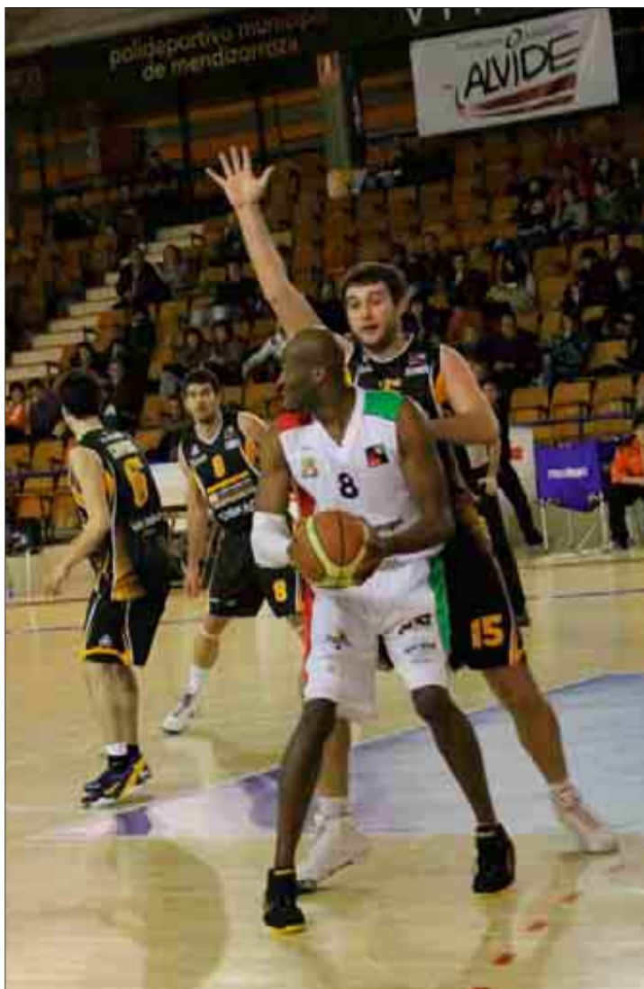
Imagen del partido entre Aurteneche y Palma Air Europa.

En el último cuarto, el conjunto insular arrancó mal, encajando dos triples en sus dos primeras