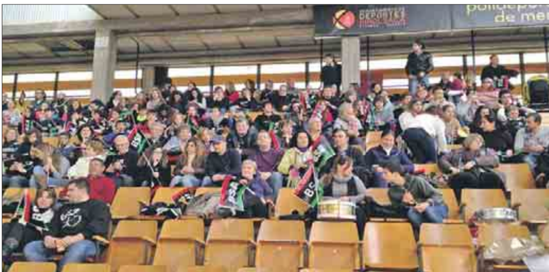
Los seguidores del Palma en la grada del pabellón de Mendizorroza. J.V.

Con una mínima ventaja local (16-14) finalizó el primer cuarto.