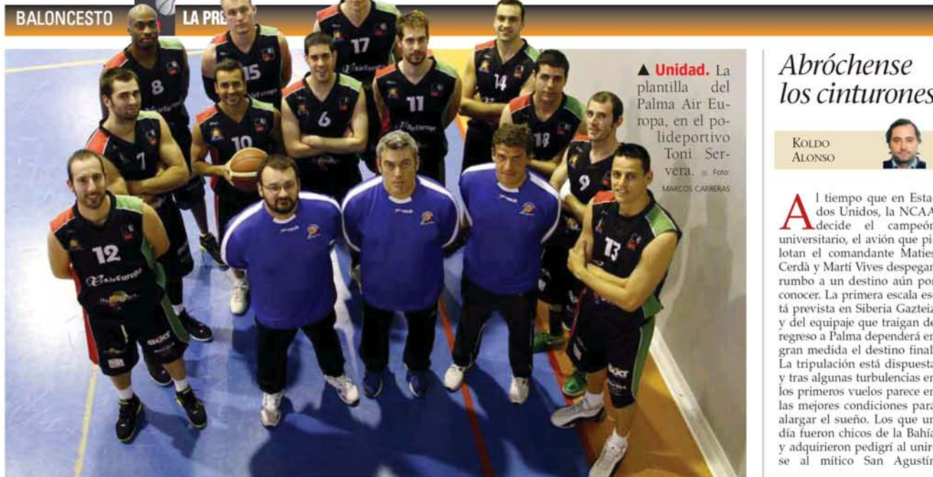
▲ Unidad. La plantilla del Palma Air Europa, en el polideportivo Toni Servera.