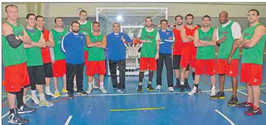
El cuerpo técnico y los jugadores del Palma, el viernes en la última sesión de la semana.