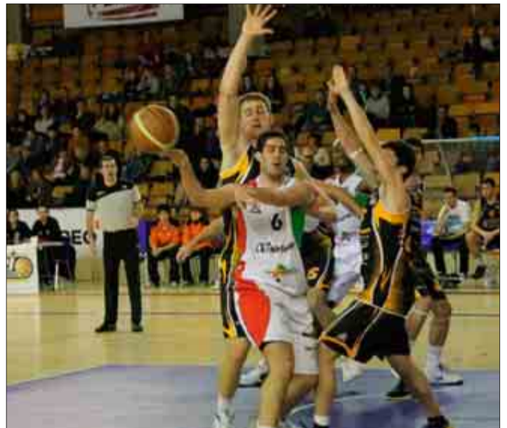
Imagen de una jugada del Aurtenetxe-Palma Air Europa de liga.

Por eso el encuentro de esta tarde, en el que los jugadores entrenados por Matías Cerdà estarán acompañados de un nutrido grupo de aficionados, tiene un pronóstico incierto. «En el último partido en casa ante el Azpeitia volvimos a recobrar las sensacio-