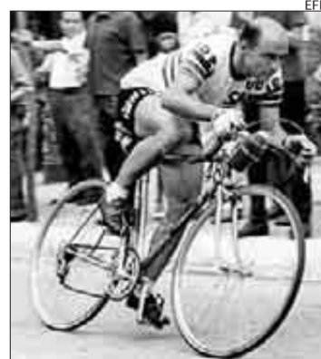
Miquel Poblet, en 1960.

Revolucionario e innovador en su técnica, este esprintador se