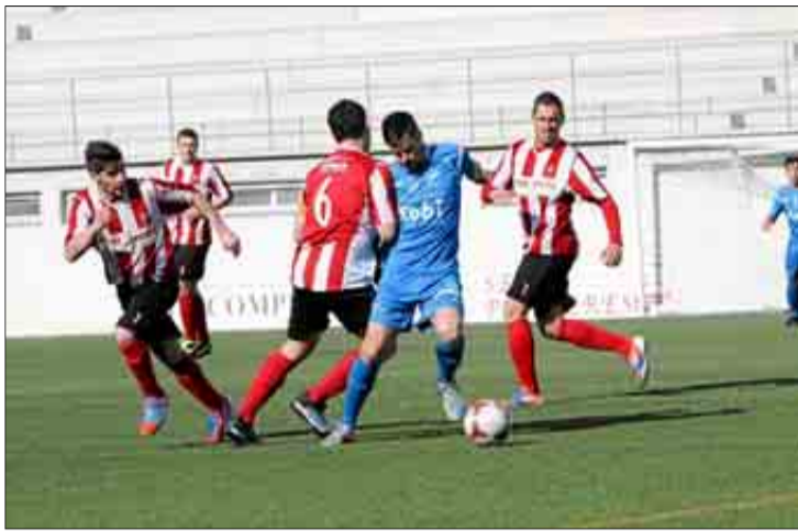
Un lance del partido de ayer en Na Capellera.