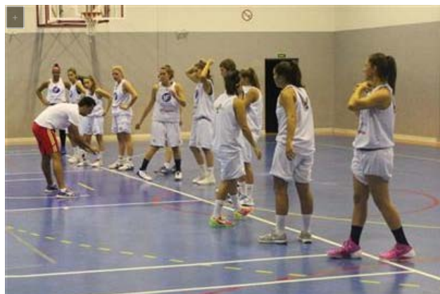
Las baleares quieren crecer en su debut en la élite