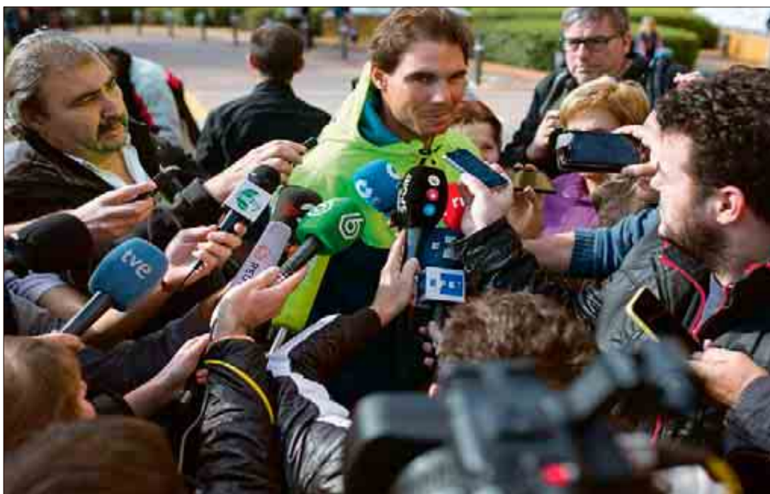
La salida de Nadal de la clínica despertó una gran expectación mediática.

Nadal adelantó que, en unos días, convocará a los medios de comunicación para valorar una temporada llena de contratiempos físicos que le han impedido rendir a su mejor nivel, pese a haber sumado otros cuatro títulos a su impresionante palmarés, entre ellos su noveno Roland Garros. “La valoración de este año y de lo que haremos el que viene la hare-