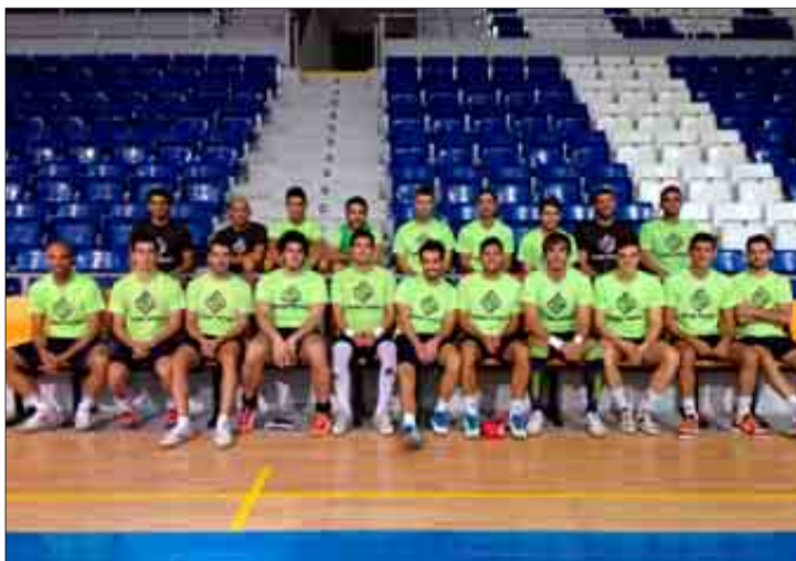
Foto de familia del Palma Futsal en Son Moix.

Los jugadores del combinado balear saben que tienen ante sí la primera oportunidad para dejar el horizonte libre para sumar puntos de cara a realizar una campaña